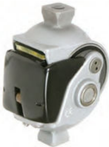
The TKO 1500 by Ossur

Algunos amputados necesitan o desean la seguridad de una articulación de rodilla que se bloquee durante la extensión y no se doble. Una opción es la rodilla con bloqueo manual, que incorpora un bloqueo automático que puede desactivarse de forma voluntaria. Es la rodilla protésica más estable que existe. Se puede andar con el bloqueo activado o desactivado, aunque la rodilla bloqueada necesita mucha fuerza al andar y ocasiona una marcha torpe y rígida. La rodilla con bloqueo manual es apropiada para pacientes con poca fuerza o equilibrio así como para personas activas que suelen caminar por terrenos inestables.