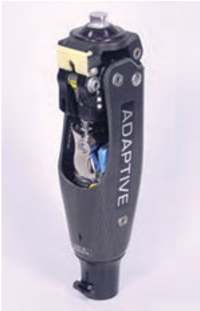
The Endolite Adaptive Knee

Las rodillas con microprocesadores, o computerizadas, son relativamente novedosas en tecnología protésica. Un sensor integrado detecta el movimiento y el ritmo, y ajusta el cilindro de mando según el caso. La información en tiempo real recopilada por el microprocesador determina qué ajuste utilizar. La rodilla con control de microprocesador reduce el esfuerzo que los amputados han de realizar para controlar el ritmo, lo que da lugar a un modo de andar más natural.