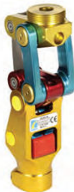
Ossur's Total Knee Junior

de fricción constante y un bloqueo manual. La fricción hace que la pierna no avance con demasiada rapidez al dar el siguiente paso. El mayor inconveniente de este tipo de rodilla es que sólo permite andar de forma óptima a una velocidad concreta. Las rodillas policéntricas, también denominadas rodillas de «cuatro barras», tienen un diseño más complicado, con ejes de rotación múltiples. Su versatilidad biomecánica es la razón principal de su gran aceptación. Pueden ser muy estables durante la fase de apoyo pero también fáciles de flexionar al iniciar la fase de oscilación o sentarse. Otra característica muy aceptada de este diseño es que la totalidad de la pierna se acorta al iniciar cada paso, reduciendo el riesgo de tropiezo.