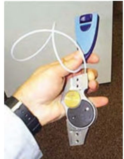
The Fillauer Swing Phase Lock with remote

La rodilla con control de apoyo SPL es el producto más reciente de Fillauer. El bloqueo previo a la fase de apoyo es automático, reproduce bastante bien los movimientos de la marcha, permite una flexión libre y una distancia entre el dedo del pie y el suelo durante la fase de oscilación, necesita menos fuerza, ofrece tres modos de control y elimina los cables y los enganches adicionales al talón. Opciones para el control del movimiento