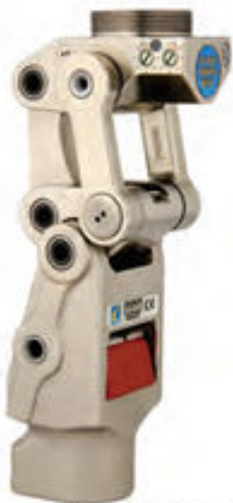
The new, improved Total Knee 2000 by Ossur

La rodilla de eje sencillo, básicamente una bisagra sencilla, suele ser considerada como «la pieza maestra» de las rodillas básicas, debido a su relativa sencillez, que la convierte en la opción disponible más económica, duradera y ligera. Por ello, se utiliza más a menudo en prótesis infantiles, especialmente porque las prótesis se quedan pequeñas casi tan rápidamente como la ropa porque los niños crecen. También es la idónea para quienes viven en zonas remotas o tienen un acceso limitado a la atención protésica.