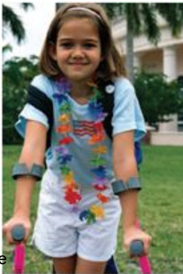
Walk Easy crutches

Keen Mobility está ofreciendo reemplazar los mangos de sus modelos de muletas más antiguos por otros diseñados recientemente como el de la muleta Keen Navigator, que todavía está disponible en tres tamaños y colores diferentes.