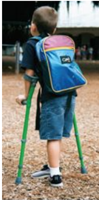
Walk Easy crutches