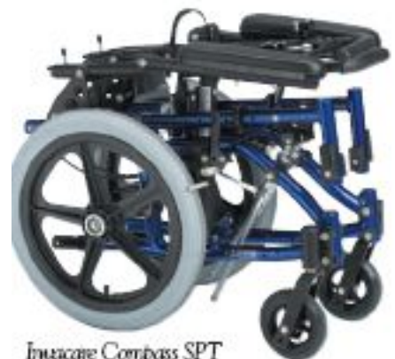
Invacare Compass SPT

La Compass SPT es una silla de ruedas convencional y al mismo tiempo reclinable y autopropulsada. Ofrece tracción delantera para facilitar la autopropulsión y puede reclinarse hasta 45 grados.