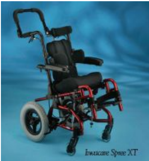
Invacare Spree XT

Dos de las últimas incorporaciones de Invacare a su línea de sillas manuales son la Spree XT para niños y la Compass SPT para adultos. La Spree XT es una silla de ruedas liviana, reclinable y plegable que se puede ajustar al crecimiento del niño. Ofrece arandelas de rápido ajuste que se fijan al chasis y permiten que el ajuste sea más rápido y fácil. También incluye ganchos de transporte para viajar de forma más segura.